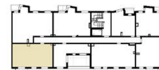
Schemat lokalizacji lokalu na kondygnacji