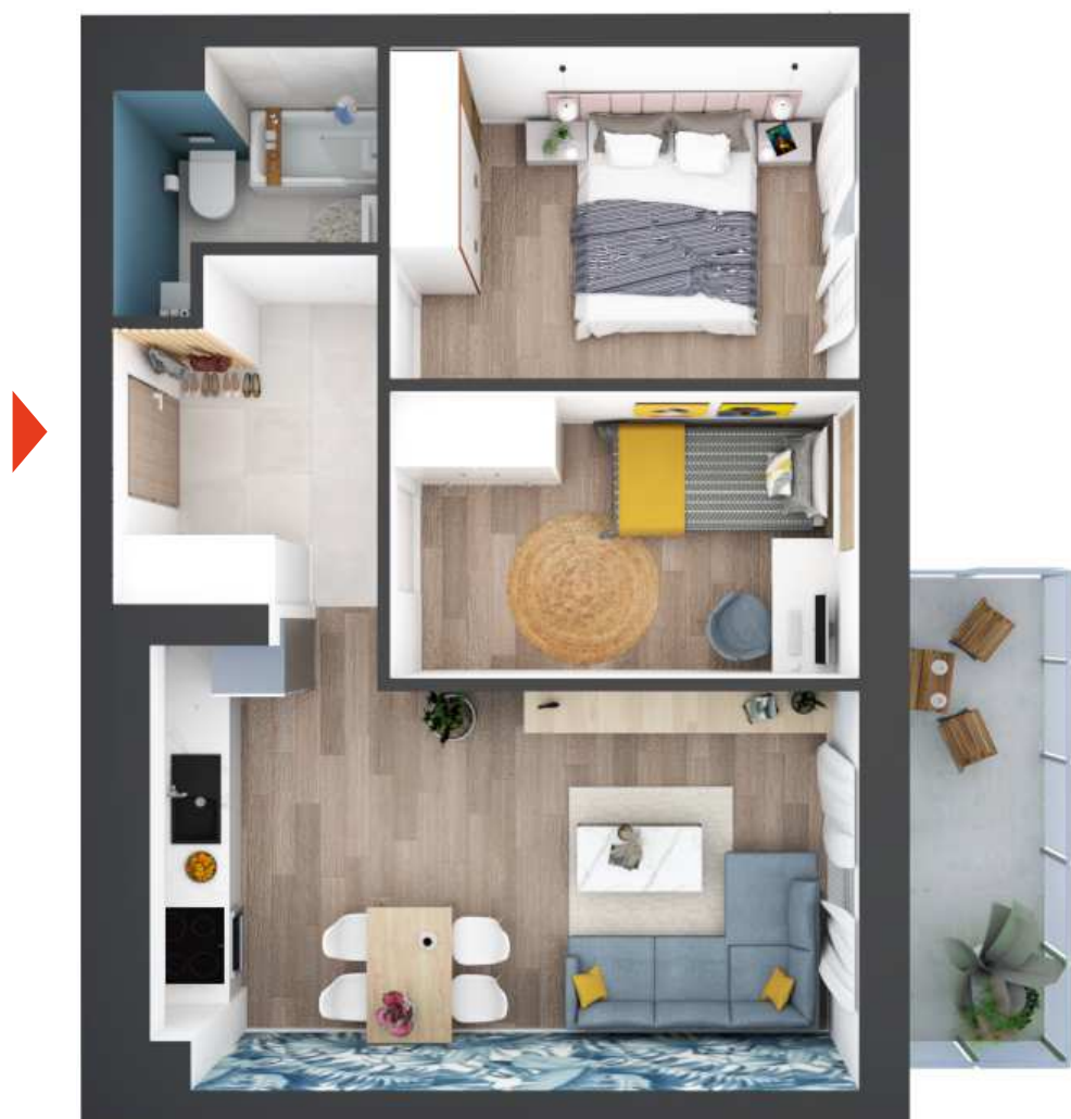
UWAGA: RZUT 3D MA CHARAKTER POGLĄDOWY I STANOWI JEDYNIĘ PRZYKŁADOWĄ ARANŻACJĘ MIESZKANIA