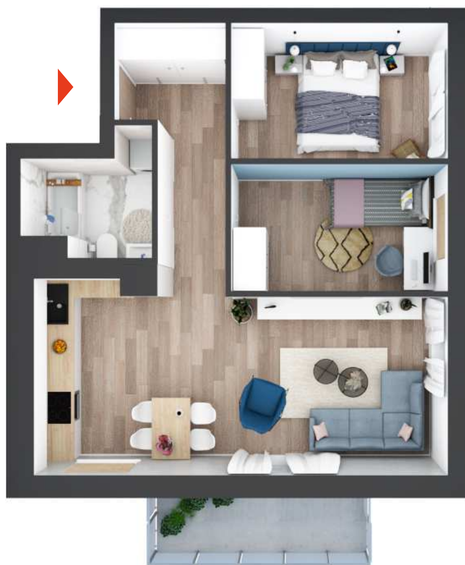
UWAGA: RZUT 3D MA CHARAKTER POGLĄDOWY I STANOWI JEDYNIĘ PRZYKŁADOWĄ ARANŻACJĘ MIESZKANIA