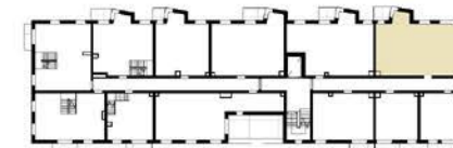
Schemat lokalizacji lokalu na kondygnacji