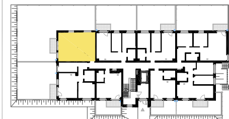
SCHEMAT LOKALIZACJI MIESZKANIA NA KONDYGNACJI